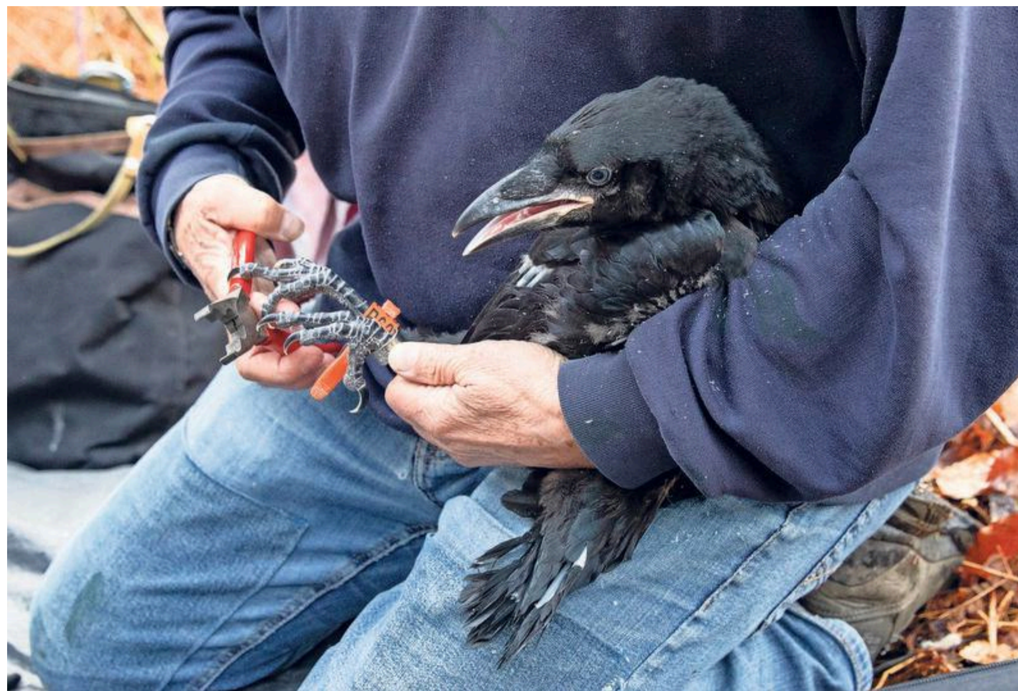
De ring gaat om de poot van een jonge raaf.